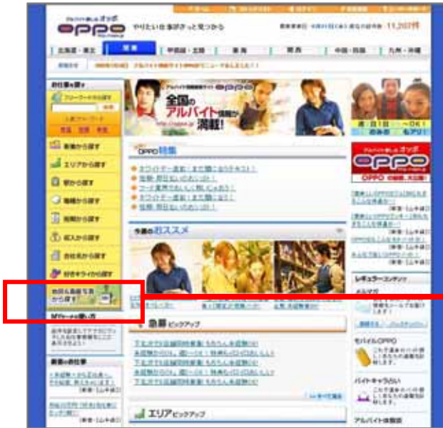
「地図&衛星写真から探す」ページ