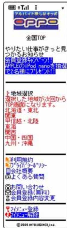
ケータイ全国 TOP ページ