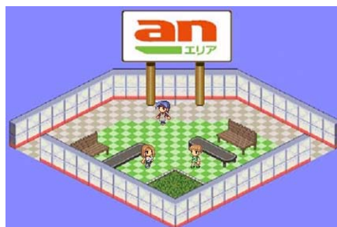
<an スクエア内 3F:コミュニティホール グリーンホール(エリア)>