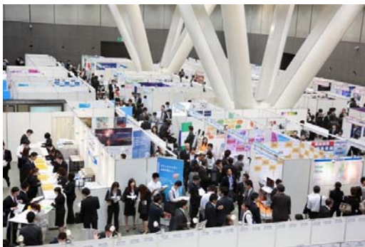
東京で開催された転職フェアの様子

「DODA 転職フェア」は、1994年に初開催して以来、出展企業数、来場者数ともに業界最大規模を誇る転職イベントです。会場には、来場者が直接採用担当者に話を聞ける企業ブースのほか、どんな業界ではたらくべきか迷う転職希望者に一対一でカウンセリングを行う「キャリアアドバイスコーナー」など、転職に関する様々な情報を集められるコーナーを設置しています。今回、東海エリアでの開催はインテリジェンスとしては初となります。