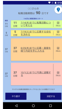
最適な転職活動 スケジュールを提案