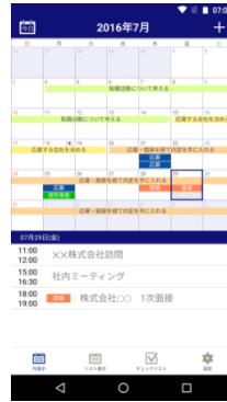
スマートフォンの カレンダーにそのまま反映