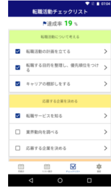
チェックリストで 活動管理