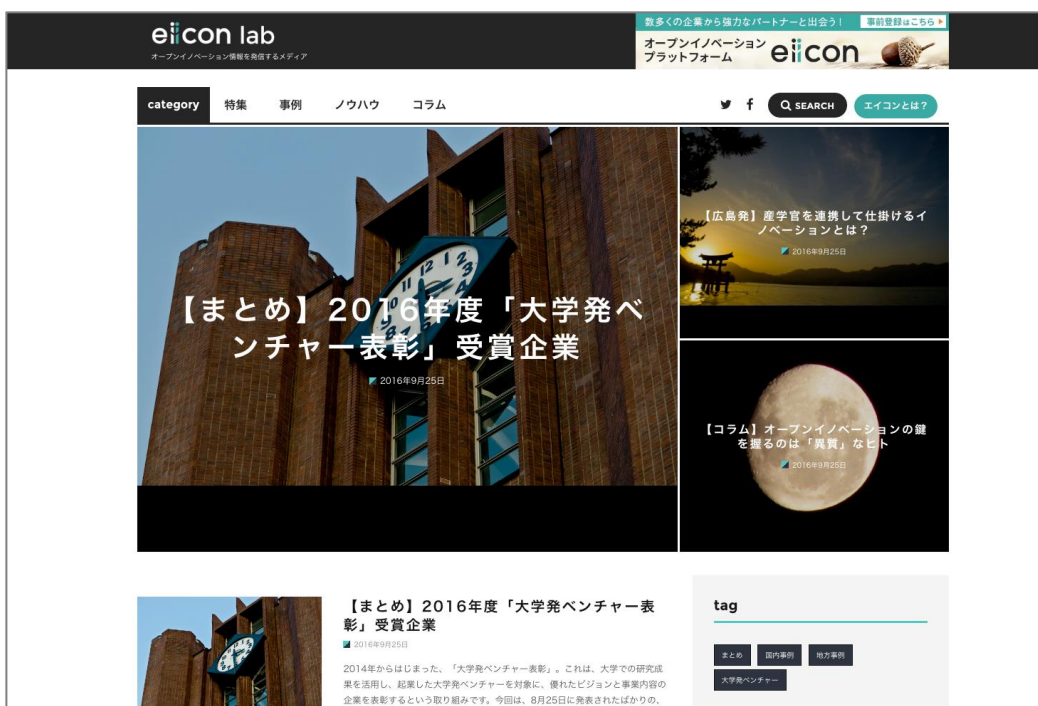
※「eiicon lab」トップ画イメージ