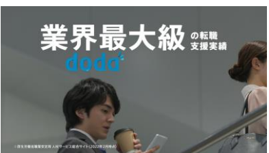
NA) 業界最大級の 転職支援実績から