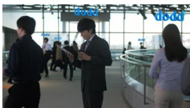
林さんセリフ) おっ