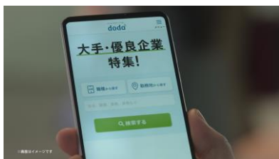
NA) 経験、スキルに合った会社を ご紹介します