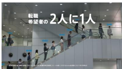
NA) 2人に1人が使っています