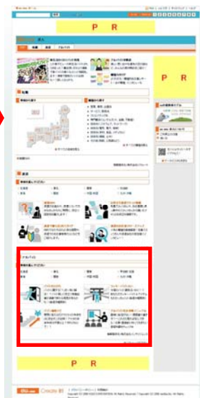
「求人カテゴリー」 トップ