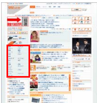
「au one」 トップ